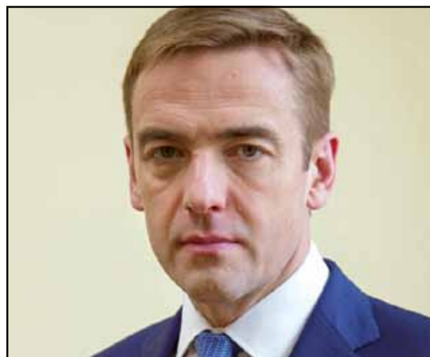
Виктор Ебтухов, заместитель министра промышленности и торговли РФ

«Мы сейчас становимся свидетелями появления стереотипов об империи зла. Вместо формулы ЕС – ЕАЭС у нас появляется формирование такого антонима между нашими интеграционными союзами...»