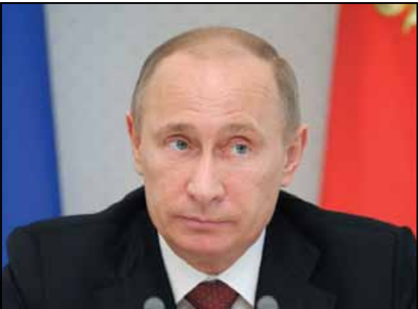
Владимир Путин, президент России

«Проблема заключается в том, что нам постоянно ставят навязывать свои стандарты и свои решения.»