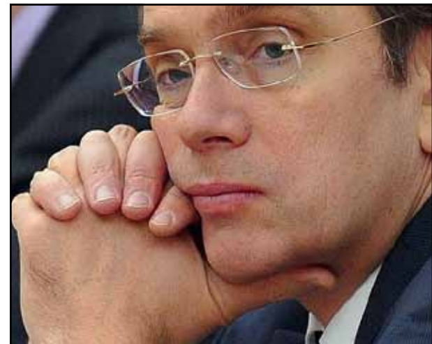
Дмитрий Панкин, председатель правления Евразийского банка развития

«Я считаю, что ЕС придется отказаться от своего нежелания более тесно сотрудничать с Евразийским экономическим союзом, в первую очередь в силу политических соображений. ЕАЭС может и должен стать политическим партнером ЕС, что в условиях напряженности между ЕС и Россией сможет обеспечить развитие необходимого политического диалога.»