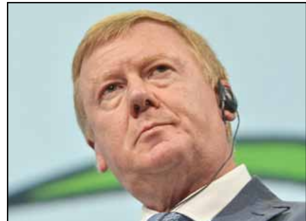
Анатолий Чубайс, председатель правления ООО «УК «РОСНАО»

«Сейчас идет речь о новой постановке вопроса. Мы обсуждаем уже не взаимодействие ЕС и России, а взаимодействие ЕС и ЕАЭС. Когда-то при формировании Европейского союза тоже было предостаточно скептиков, которые не верили в успех этого предприятия.»