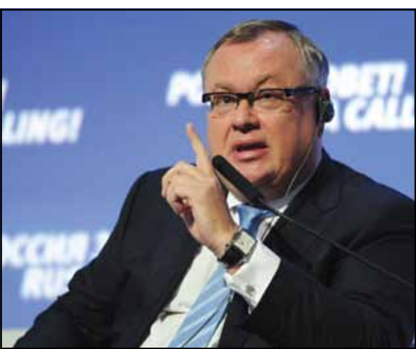
Андрей Костин, президент ВТБ

«Финансовая система породила самый крупный финансовый кризис 2007-2009 годов...»