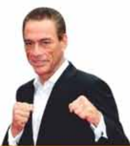
ЖАН-КЛОД ВАН ДАММ