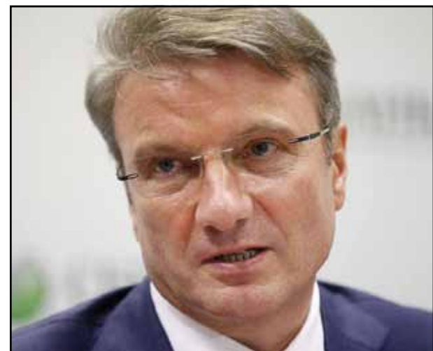
Виктор Ебтухов, заместитель министра промышленности и торговли РФ