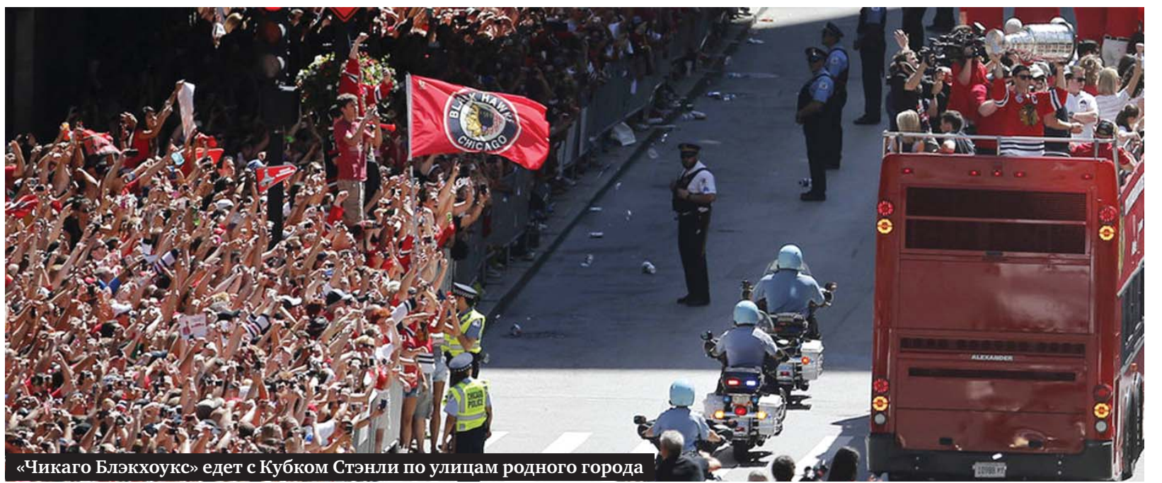
«Чикаго Блэкхоукс» едет с Кубком Стэнли по улицам родного города