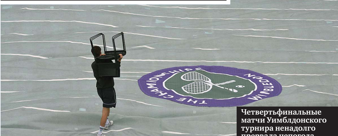
Четвертьфинальные матчи Уимблдонского турнира ненадолго прервала непогода