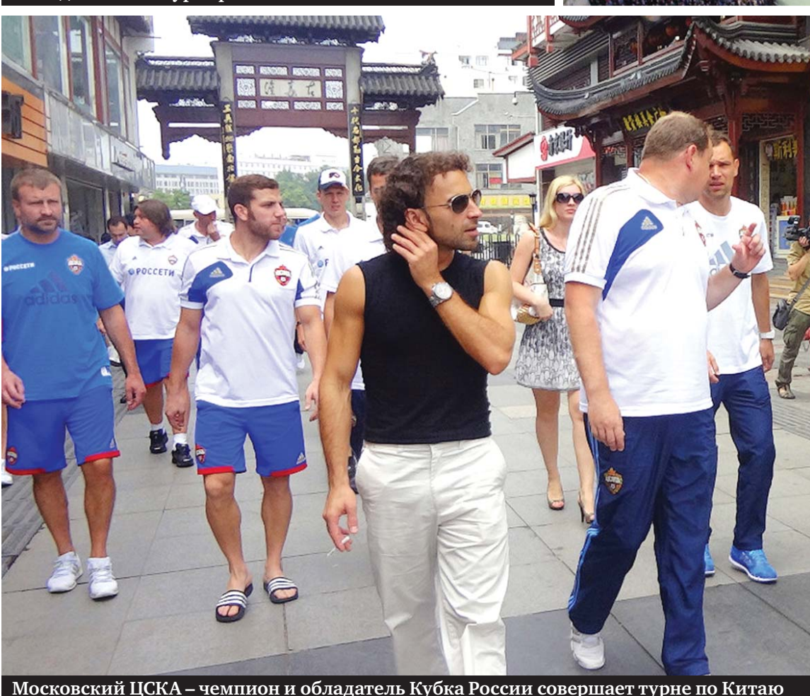
Московский ЦСКА – чемпион и обладатель Кубка России совершает турне по Китаю