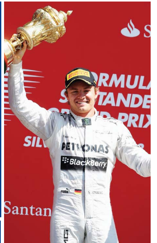
Пилот «Мерседеса» Нико Росберг празднует победу на «Гран-при Великобритании»