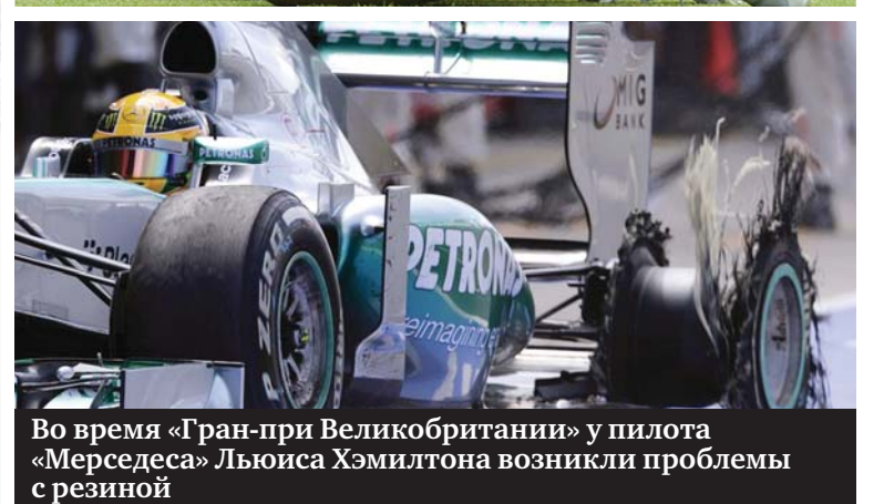
Во время «Гран-при Великобритании» у пилота «Мерседеса» Льюиса Хэмилтона возникли проблемы с резиной