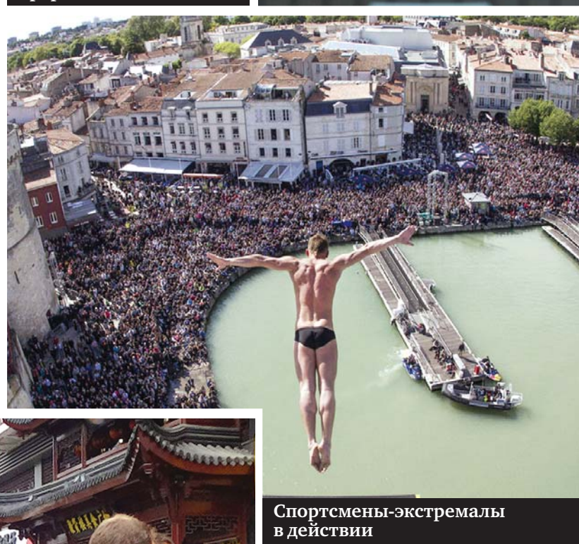
Спортсмены-экстремалы в действии