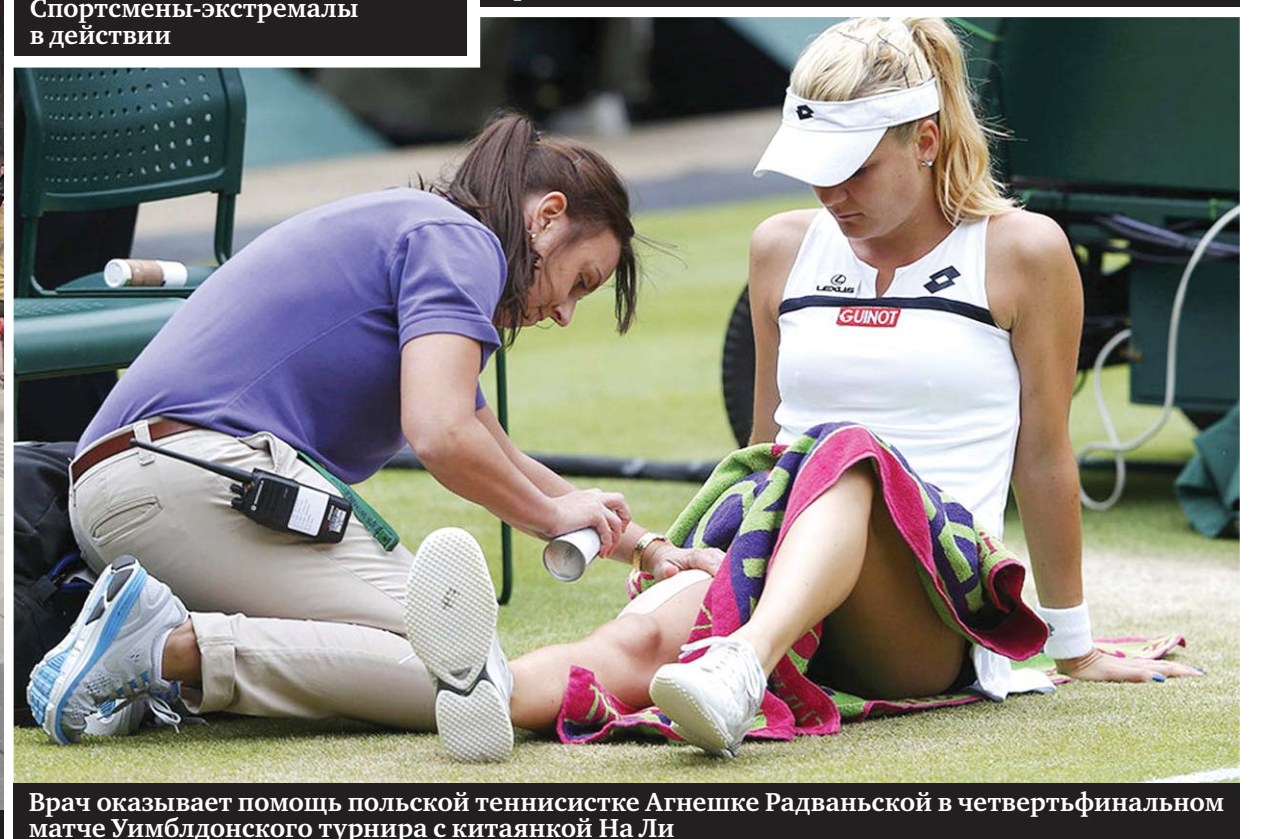
Врач оказывает помощь польской теннисистке Агнешке Радваньской в четвертьфинальном матче Уимблдонского турнира с китайкой На Ли