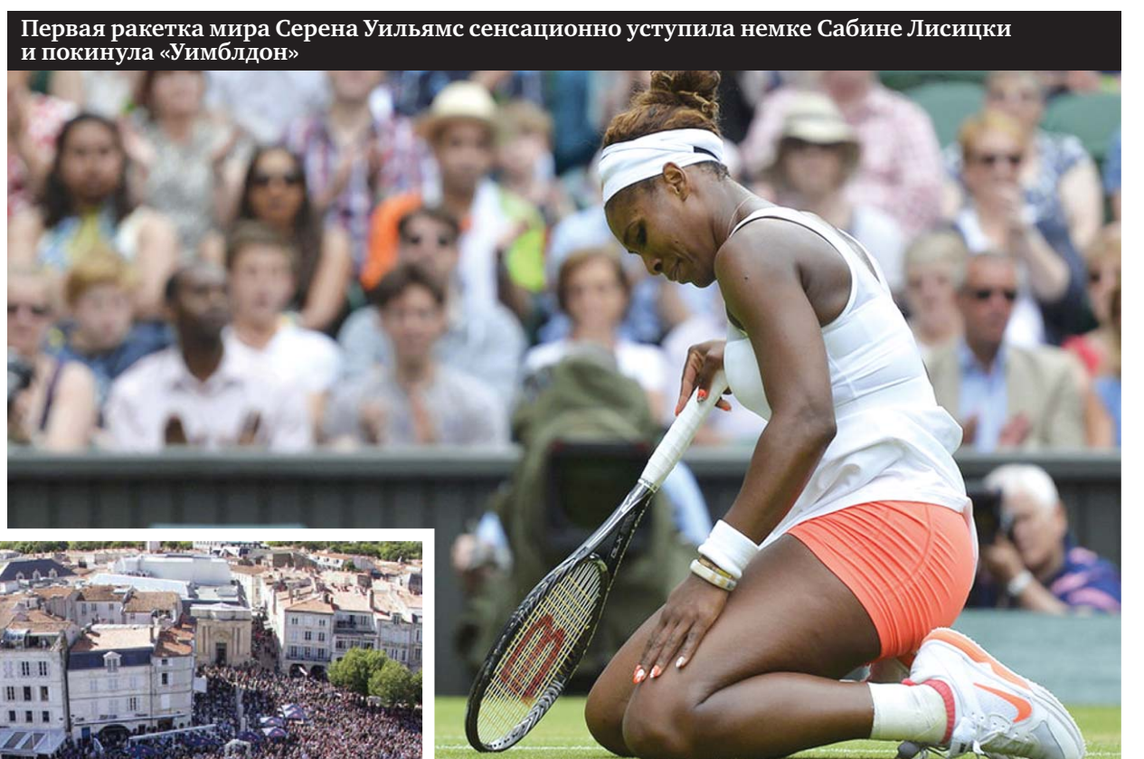
Первая ракетка мира Серена Уильямс сенсационно уступила немке Сабине Лисицки и покинула «Уимблдон»