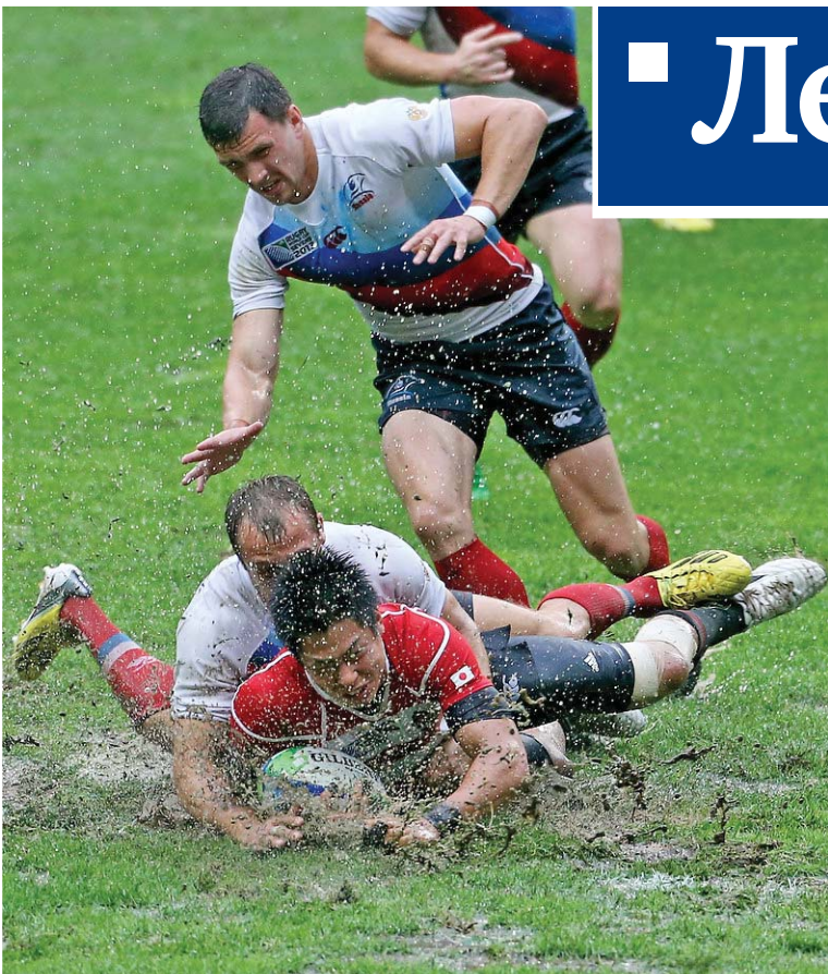
Момент финального матча Россия – Япония на Кубке мира по регби-7