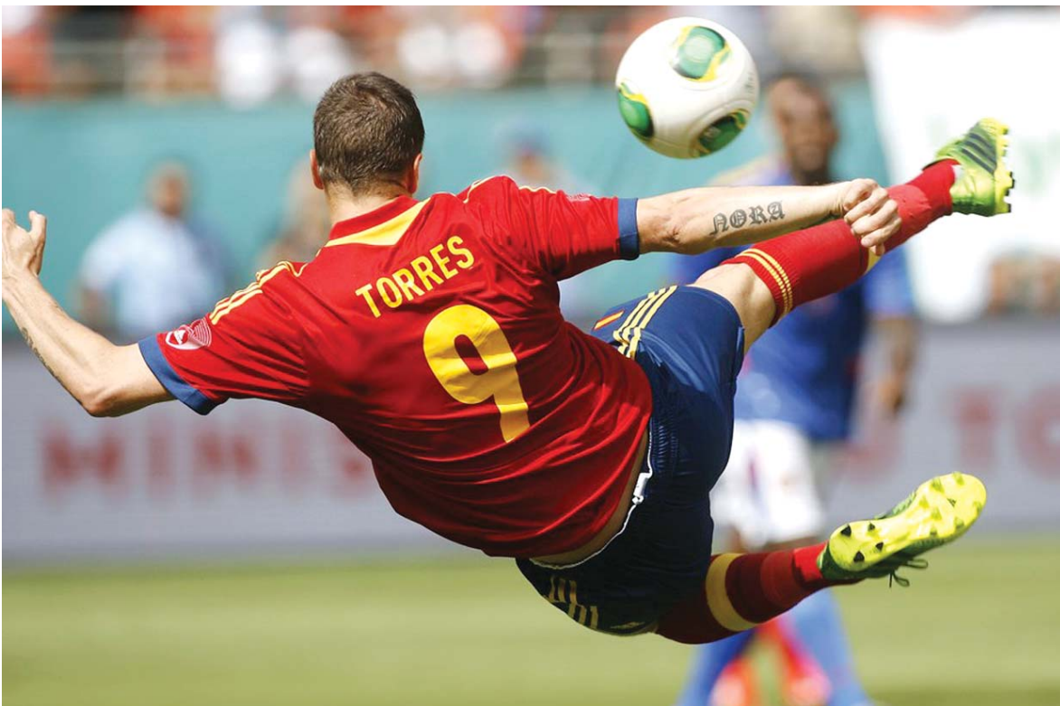
Фернандо Торрес наряду с бразильцем Фредом стал лучшим бомбардиром Кубка конфедераций (5 голов)

Лето, как известно, период отпусков и чемоданного настроения. Однако не все могут позволить себе отдых и возможность расслабиться. Представители большого спорта, несмотря ни на что, продолжают радовать своих любителей красивыми выступлениями и результатами даже в самые жаркие месяцы.