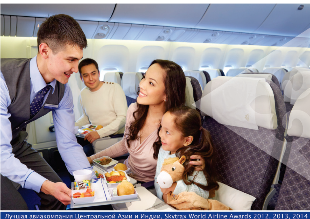
Лучшая авиакомпания Центральной Азии и Индии, Skytrax World Airline Awards 2012, 2013, 2014

Для бронирования и информации 8 (7172) 58 44 77, 8 (727) 244 44 77.