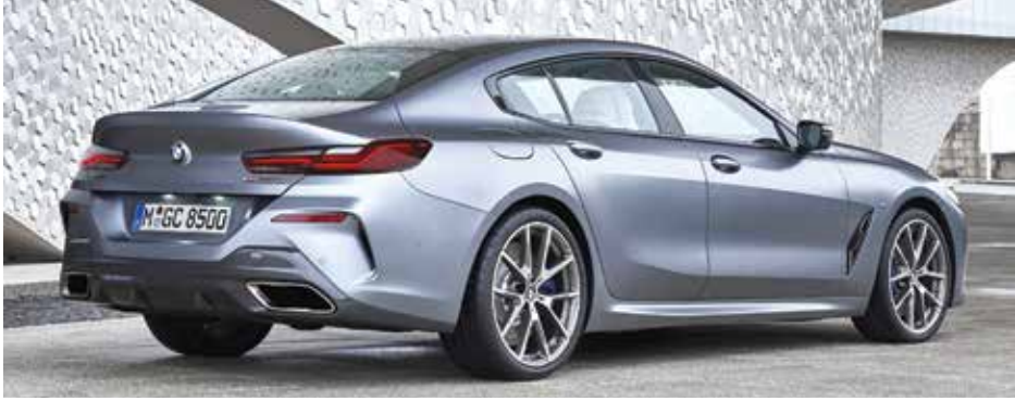
BMW: «восьмерка» Gran Coupe и концепт Vision M Next

Сегодня в рубрике: аттракцион неслыханной щедрости от Правительства РК, двойные новинки от BMW и Audi, хорошая новость для поклонников Ford Mustang Bullitt и новый рекорд скорости на тракторе