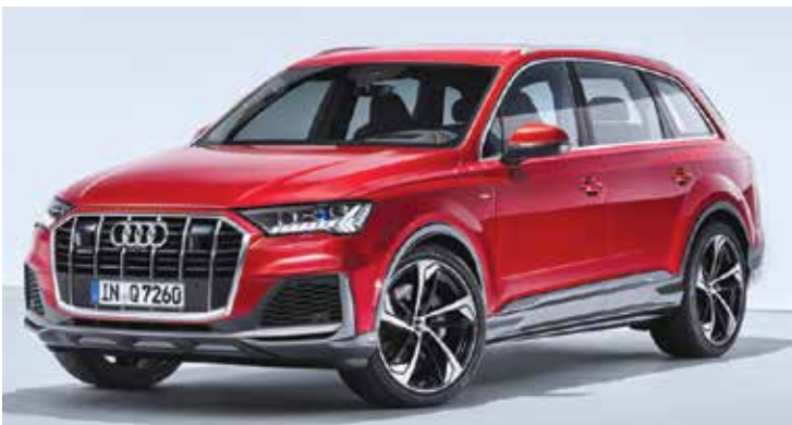
Audi: обновленный Q7 и «заряженный» Q8

Audi с небольшой разницей во времени представила обновленный большой кроссовер Q7, выпускающийся с 2015 года, и спортивную версию флагманского кроссовера Q8 – SQ8.