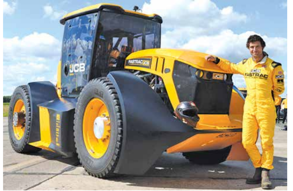
Рекорд скорости на тракторе

165,8 км/ч – до такой скорости британский мотогонщик и телеведущий Гай Мартин разогнал подготовленный трактор JCB Fastrac на аэродроме Элвингтон, установив новый рекорд скорости для колесных тракторов (прежний рекорд был 140 км/ч). Трактор-рекордсмен оснащен стандартным 7,2-литровым дизелем мощностью 1000 л.с., но его аэродинамика доработана специалистами компании Williams Advanced Engineering. Также они уменьшили массу машины.